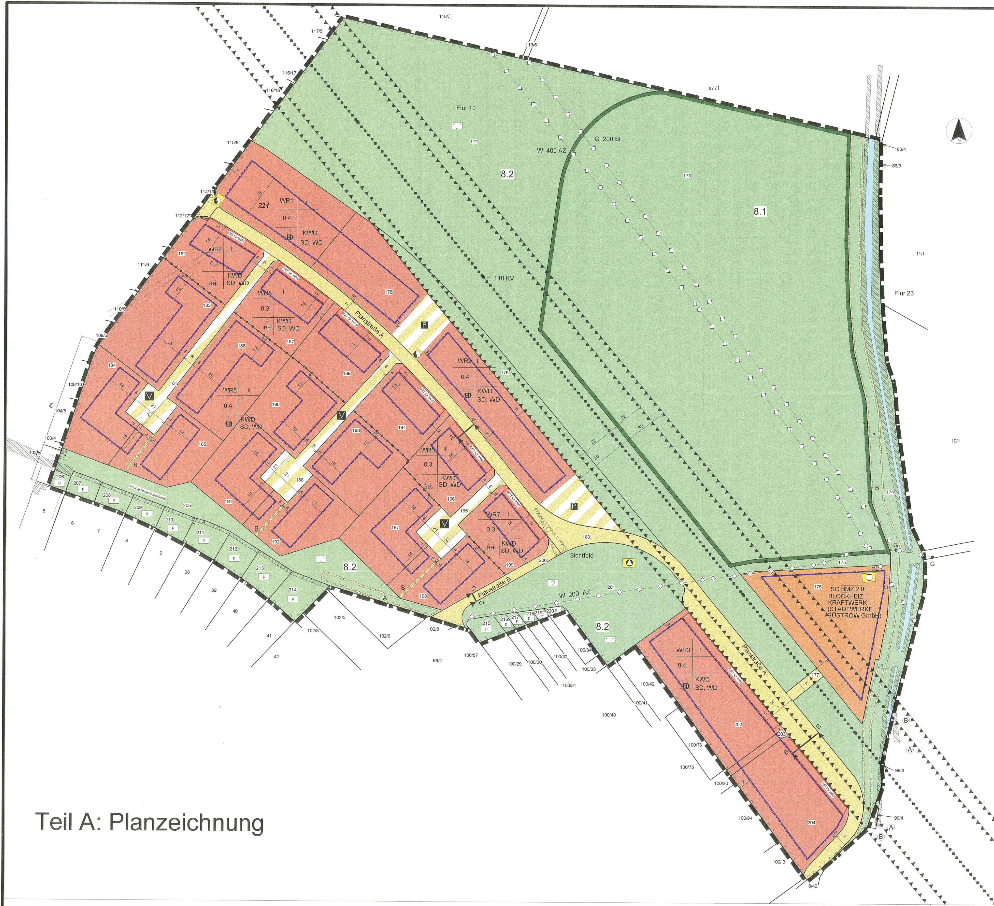
Teil A: Planzeichnung